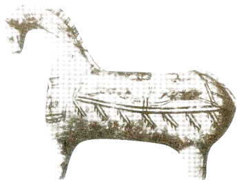
تصویر 1- ریتون به شکل اسب سفالی، شوش، قرن 8 ق.م (افضل طوسی، 1393: 45)

از دیرباز تاکنون اسب در تکامل زندگی بشر نقش فراوانی ایفا کرده است. یکی از نخستین حیوانات سودمندی است که انسان یکجانشین آن را رام کرد. اسب علاوه بر این نقش حیاتی خود توانست به عنوان سلاحی نیرومند و کارآمد در میدان نبرد و کشورگشایی شاهان به مقامی بالا در خاطره بشری دست یابد. چنانچه در تمدن‌های ابتدایی برخی ملل "اسب‌هایی که در جنگ کشته می‌شدند با تشریفات به خاک سپرده می‌شدند که هومر نیز در حماسه ایلیاد از آنها نام برده است" (دایجست بوک، 1392:52). شاید به همین دلیل است که در اسطوره‌ها و مراسم دینی بسیاری از تمدن‌ها، اسب