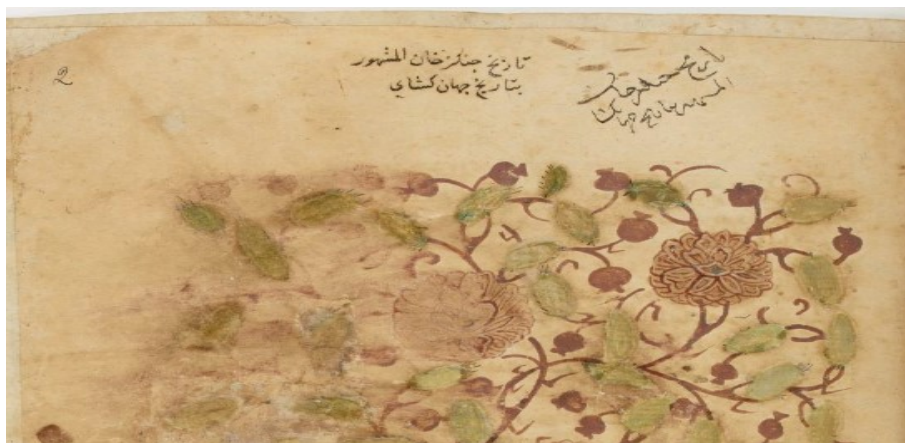
صفحه ۲ جهان گشا از نسخه ۲۰۵ کتابخانه ملی پاریس